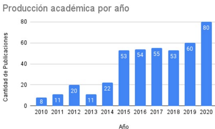
Cuadro No 1. Evolución de las publicaciones sobre las relaciones entre China y América Latina entre 2010 y 2020, Elaboración de CRIES.

desarrollo acelerado de enfoques teóricos y conceptualizaciones en el Sur Global, pero, asimismo, una interconexión y una interfecundación en distintos ámbitos y espacios académicos entre las diferentes vertientes que dan lugar a una amplia producción de publicaciones.